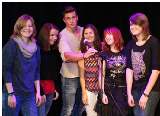
Foto: die Vortragenden am Finalabend